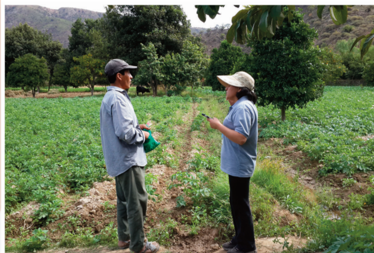
Cotizadora del IPP entrevista a productor de la comunidad K'acha K'acha